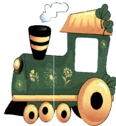
Поезд, Машинист, Вагоны.